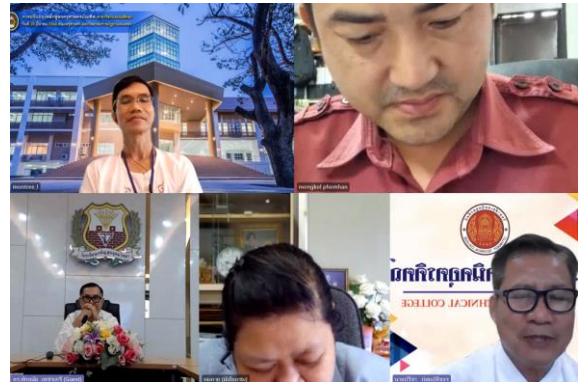
ตัวอย่างรูปภาพการสัมภาษณ์ความต้องการของกลุ่มผู้มีส่วนได้ส่วนเสีย