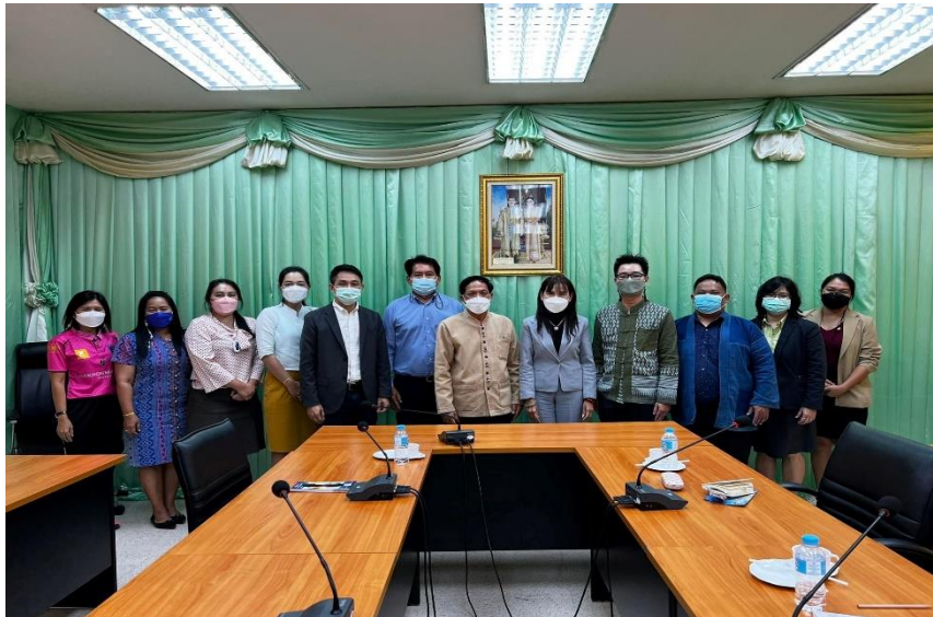
ภาพที่ 3 การจัดเวทีรับฟังความคิดเห็นปัญหาและความต้องการในการพัฒนาศักยภาพของผู้บริหารและบุคลากร หน่วยงานภาครัฐ ผู้อำนวยการโรงเรียน ครู อาจารย์ ผู้นำชุมชน ณ เทศบาลนครแม่สอด จังหวัดตาก

ผลการศึกษา พบว่า ผู้บริหาร เจ้าหน้าที่ทั้งหน่วยงานภาครัฐและภาคเอกชน มีผู้ที่สนใจเข้าศึกษาต่อระดับปริญญาโทของสาขาวิชายุทธศาสตร์การบริหารและพัฒนาค่อนข้างมาก เนื่องจากต้องการได้รับความรู้เพื่อใช้ในการกำหนดแผนงาน/ยุทธศาสตร์การพัฒนาพื้นที่แม่สอด โดยต้องการให้มีการจัดการเรียนการสอนในพื้นที่อำเภอแม่สอด ซึ่งจะทำให้ผู้เรียนจะมีสะดวก หากมาเปิดสอนน่าจะมีคนสนใจเข้าศึกษาต่อค่อนข้างมาก โดยเฉพาะอย่างยิ่งขณะนี้แม่สอดมีโครงการพัฒนาขนาดใหญ่ต่าง ๆ เข้ามามากมาย หากคนในพื้นที่ทั้งหน่วยงานภาครัฐ ภาคเอกชนได้ยกระดับความรู้ จะสามารถทำให้สามารถแผนงาน/โครงการเพื่อพัฒนาเมืองแม่สอดให้คนในพื้นที่ได้รับประโยชน์มากขึ้น ส่วนความ