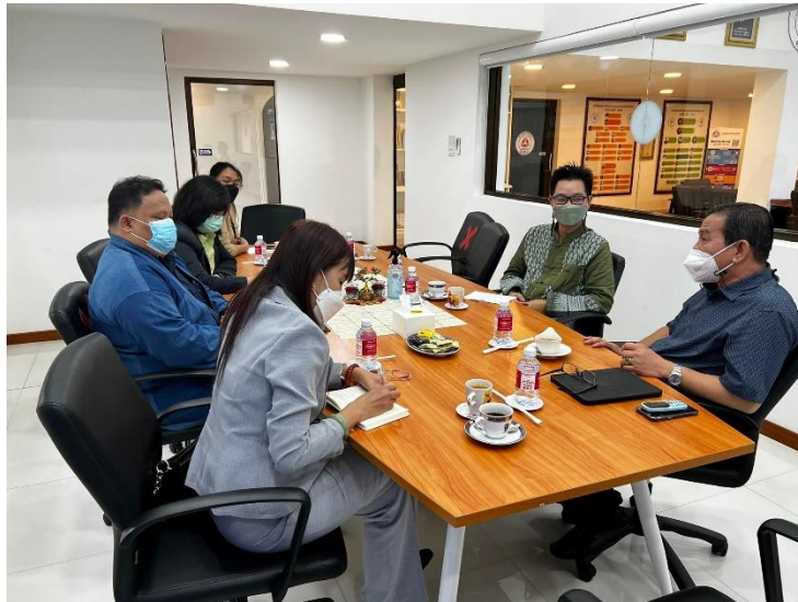
ภาพที่ 1 การสัมภาษณ์แบบเจาะลึก (In-Depth Interviews) ผู้บริหารสภาอุตสาหกรรมจังหวัดตาก

1. ศึกษาปัญหา และความต้องการในการพัฒนาความรู้ ทักษะ และความต้องการในการศึกษา ต่อระดับปริญญาโทของบุคลากรภาครัฐ ภาคเอกชน และประชาชนในพื้นที่อำเภอแม่สอด จังหวัดตาก โดยการสัมภาษณ์แบบเจาะลึก (In-Depth Interviews) การสนทนากลุ่ม (Focus group Discussion) และการจัดเวทีรับฟังความคิดเห็นปัญหาและความต้องการในการพัฒนาศักยภาพของผู้บริหารและบุคลากรในพื้นที่แม่สอด ผู้ให้ข้อมูล ประกอบด้วย ประธานสภาอุตสาหกรรมจังหวัดตาก รองประธาน หอการค้าแม่สอด และกรรมการหอการค้าแม่สอด จังหวัดตาก รองนายกเทศมนตรี หัวหน้าฝ่าย วางแผนและนโยบายเทศบาลแม่สอด สมาชิกสภาเทศบาลแม่สอด เจ้าหน้าที่เทศบาลนครแม่สอด หัวหน้าส่วนราชการ ผู้อำนวยการสถานศึกษา ครู อาจารย์ ผู้นำชุมชน ระหว่างวันที่ 10 สิงหาคม 2565 ที่ผ่านมา