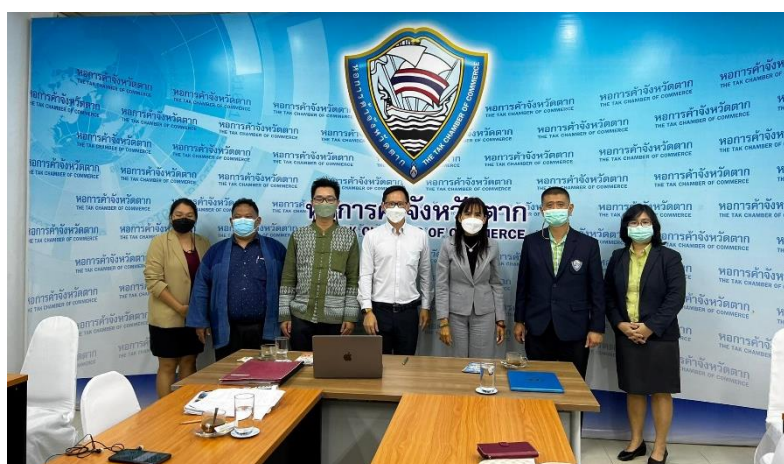
ภาพที่ 2 การสนทนากลุ่ม (Focus group Discussion) ผู้บริหารหอการค้าจังหวัดตาก