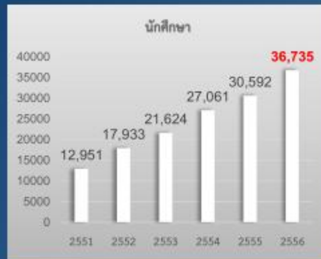
จำนวนนักศึกษาที่ปฏิบัติงานสหกิจศึกษา