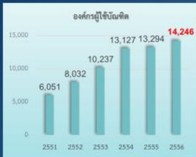
จำนวนองค์กรผู้ใช้งานฝึกที่รับนักศึกษาสหกิจศึกษา