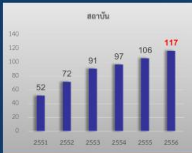
จำนวนสถาบันอุดมศึกษาที่ดำเนินงานสหกิจศึกษา